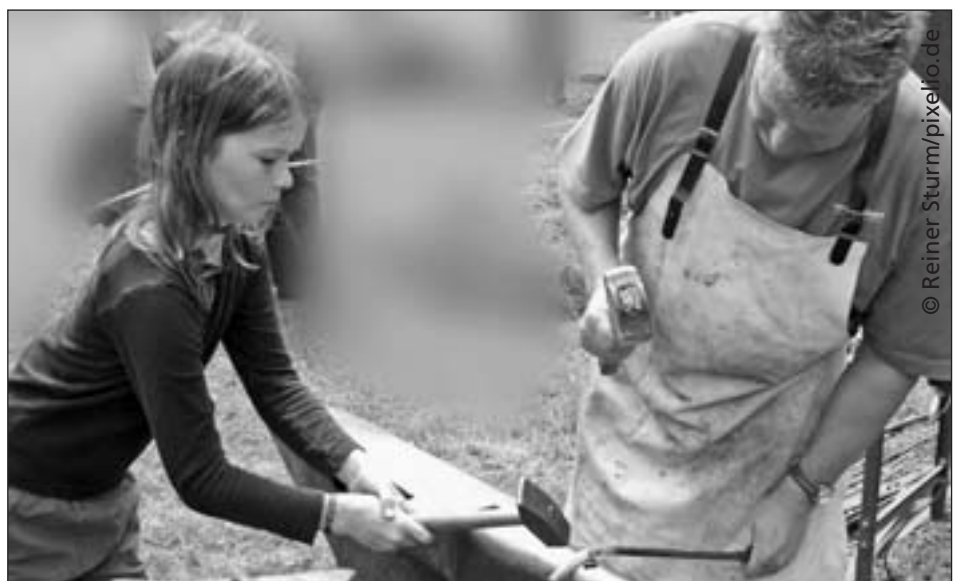
Jugendliche bei der Ausbildung

Erst mit dem Aufstieg des Bürgertums wird Aussicht auf Mündigkeit für alle überhaupt denkbar. Heinz-Joachim Heydorn (1916 – 1974), Mitbegründer des SDS, Synodaler der Evangelischen Kirche, zuletzt Professor für Pädagogik an der Technischen Hochschule Darmstadt, verfolgt diesen Prozess. „Im Sinne des Aufstiegs hieß Mündigkeit, daß das gesamte Geschlecht, wie es unter dem Begriff des Menschen gefaßt wird, alles Verschlissene, Untergetauchte, in das Licht des Bewußtseins gerückt wird“ (Heydorn 1972, S. 8). Dieser Anspruch einer Bildung für alle bricht sich aber an der Wirklichkeit weiter bestehender Herrschaft. „Die aufsteigende bürgerliche Klasse hat den Begriff der Mündigkeit der Bildungsinstitution in einem Augenblick verbunden, in dem sie diese zu einer frühen, bedeutsamen Reife brachte. Sie tat das mit dem Anspruch, Sachwalter aller Menschen zu sein. Jedoch ist dies nur vorübergehend; der Anspruch blieb auf die Klasse beschränkt, die ihn, mit wachsender Akku-