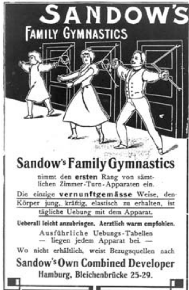
Sandows Family Gymnastics: Werbespropekt für einen Heimtrainingsapparat um 1900

tierungslosen Bürger bringen wollten, versteht sich von selbst. Seriöse Lebensreformzeitschriften warnen denn auch vor denjenigen Autor/-innen, die auf den neuen Körpertrend aufspringen und den unbedarften Abnehmern bloß ihre Apparate und Gymnastiksysteme „andrehen“ wollten. 10