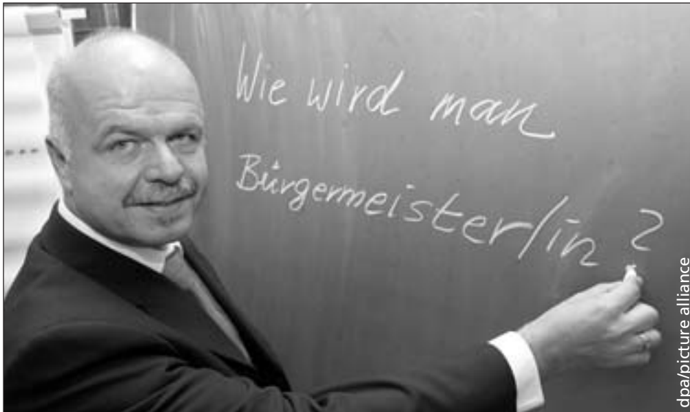
Notwendiges Thema der politischen Bildung?

und „durch die angespannte Finanzsituation bei allen Beteiligten ... politische Weiterbildung wie jede andere Ausgabenposition auch verstärkt unter dem Druck (steht), ihre Notwendigkeit und Nützlichkeit nachzuweisen.“ (Kultusministerkonferenz 1998, S. 328)